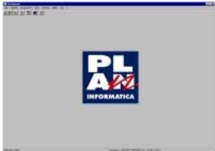
SCHERMATA di PRESENTAZIONE

Software di rilevazione mano d'opera per commessa integrato alla procedura "TESEO"