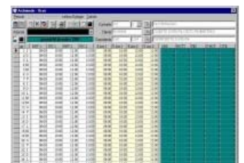
ESEMPIO di RILEVAZIONE